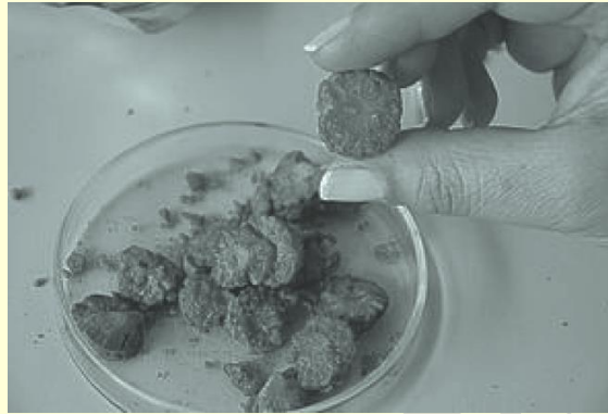
Moras enriquecidas con probióticos y prebióticos

Moras probióticas para transformar la lonchera Ingenieros de alimentos quieren revolucionar la industria con comestibles de paquete saludables. Con este fin, utilizan microorganismos benéficos para la salud en productos poco tradicionales, como las moras de castilla. El objetivo es ofrecer una nutritiva y atractiva golosina crujiente.